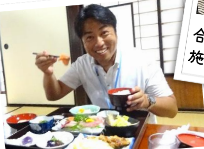
南相馬市内で昼食