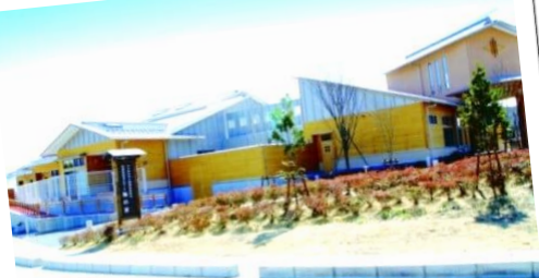
特別養護老人ホーム 梅の香 を見学