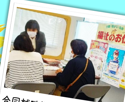
合同就職説明会で、いろんな 施設の話聞いてみよう