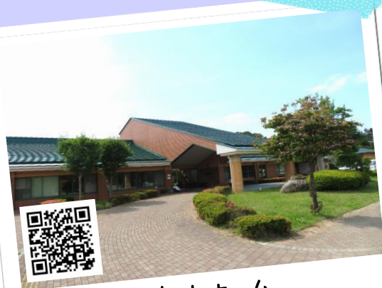
特別養護老人ホーム 船引こぶし荘を見学