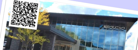
介護老人保健施設 歩 特別養護老人ホーム 花音を見学